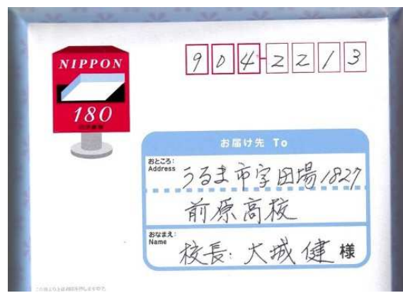
(沖縄県うるま市・前原高校)